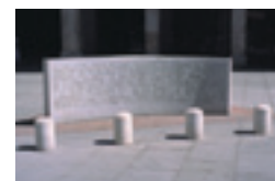
(上) サンタ・クルス・パレス (下) 昔の刑務所にある石碑。

建物が付属刑務所として追加された。横長の2階建ての建物で、十字架のついた2つの大きな塔がそびえている。建物の正面にはスペインの武器と天使が表された紋章がある。パレスの中に石造りの大きな階段があり、ドリド式、トスカナ式の柱に円アーチ形の2つの側廊が特徴的である。