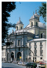
サン・フランシスコエル・グランデ教会